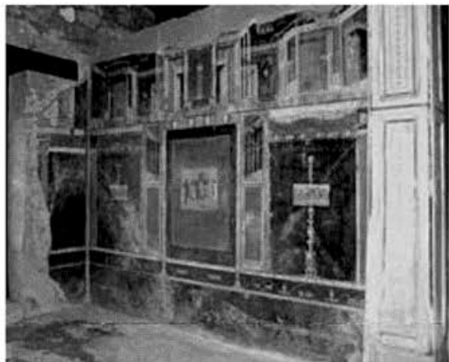
La Domus di Marco Lucrezio Frontone. A destra, la Casa in uno scatto di Luciano Fontana (nella foto piccola)